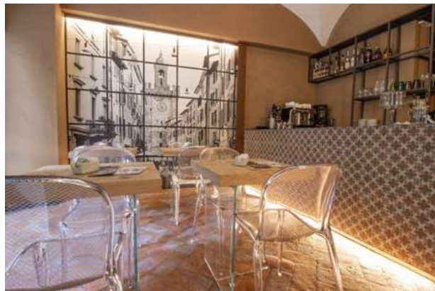
Applicazione intonaco YOSIMA

I materiali dell'edilizia ecocompatibile utilizzati (CLAYTEC, NATURATHERM, NATURAWALL e YOSIMA) hanno permesso di raggiungere un risultato impeccabile in tutti gli obiettivi prefissati: garantire l'isolamento dell'edificio attraverso l'uso di un cappotto interno; mantenere l'aspetto dell'edificio con l'andamento fuori piombo originario delle pareti, affinché i visitatori della Locanda delle Mercanzie non abbiano la percezione che l'edificio sia stato stravolto con la ristrutturazione; regolare igrometricamente gli ambienti attraverso le rifiniture YOSIMA; utilizzare colori in tonalità naturale delle terre, dunque colori caldi, scelti tra la