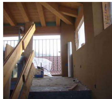
Zona della torretta durante la ristrutturazione con prodotti Naturalia-Bau

Da ultimo, per la finitura è stato utilizzato YOSIMA INTONACHINO DESIGN; essendo esso un prodotto a base di argilla ha la qualità di mantenere l'equilibrio igrometrico delle stanze della Locanda delle Mercanzie grazie alla sua caratteristica di assorbire l'umidità e liberarla successivamente e gradualmente. La scelta di YOSIMA come materiale di finitura ha anche consentito di giocare con le colorazioni, avendo a disposizione un'ampia gamma di colori caldi e naturali. Si è deciso di accostare i colori YOSIMA con due obiettivi: fare risaltare le particolarità della struttura e dare ai visitatori una sensazione visiva di calore e di benessere.