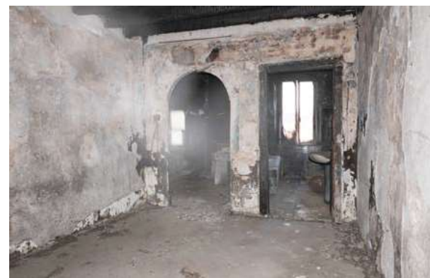
Edificio prima dell'intervento

Nel momento in cui si è deciso di ristrutturare l'edificio per renderlo una "Locanda Lombarda", esso versava in condizioni pessime. Durante la considerevole operazione di ristrutturazione, una delle problematiche affrontate