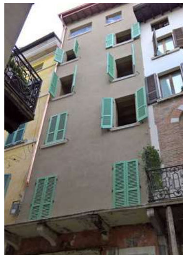
Edificio prima dell'intervento

gamma dell' "oro ocra" e del "giallo canneto" e poterli abbinare e mescolare tra loro; infine, la posa dei pannelli isolanti ha immediatamente offerto una sensazione di benessere acustico, grazie alla loro capacità di ridurre il riverbero.