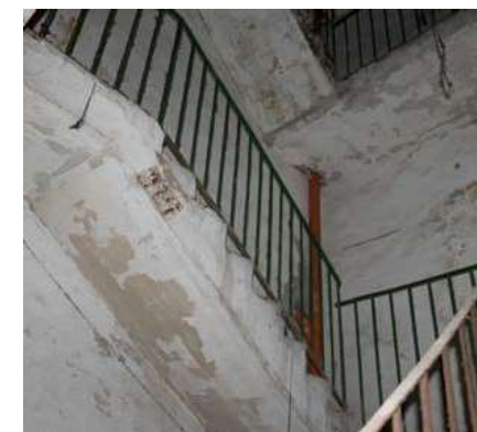
Edificio prima dell'intervento

è stato l'isolamento termico delle pareti. Trattandosi di un edificio in centro storico non si è potuti intervenire esternamente sulle facciate e neppure sulle pareti longitudinali in quanto confinanti con altre strutture abitative. Questo motivo ha determinato la scelta di intervenire applicando un cappotto interno; l'utilizzo di materiali dell'edilizia ecocompatibile ha diverse motivazioni basate sia su scelte progettuali ed estetiche che su considerazioni più tecniche. I muri dell'edificio della Locanda delle Mercanzie sono in pietra e cotto, è stato necessario l'utilizzo di materiali traspiranti per evitare il formarsi di umidità al loro interno, per questo obiettivo si è ritenuto che i materiali NATURATHERM e NATURA-