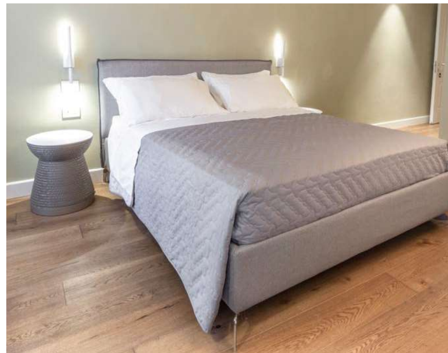
Applicazione con YOSIMA nelle camere da letto