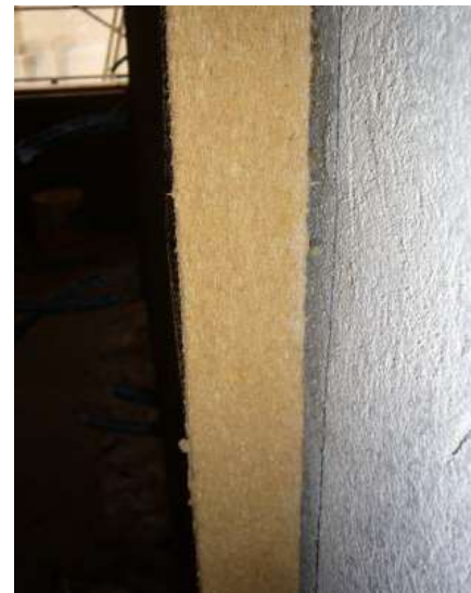
Soluzione NATURADENTRO - applicazione del primo strato di NATURATHERM